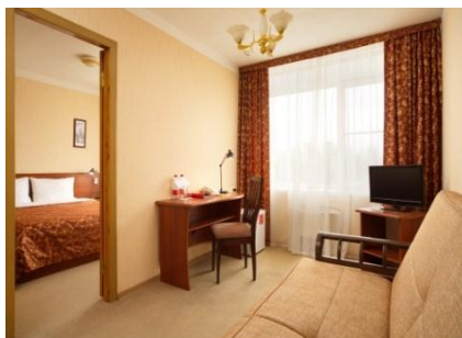
Стандарт 2-х комнатный